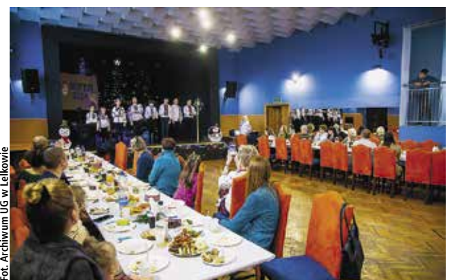
Kutia – wspólne śpiewanie, kosztowanie potraw i zabawa

Kutia to tradycyjne spotkanie bożonarodzeniowe społeczności ukraińskiej. W gminie Lelkovo odbyło się ono w Gminnym Centrum Kultury