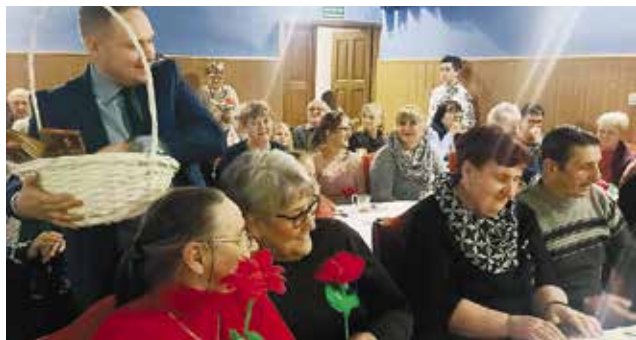
Babcie i dziadkowie otrzymali słodkie upominki