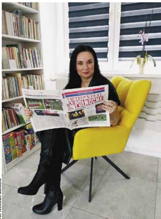
Na takim wygodnym fotelu można usiąść i oddać się lekturze Nowin Północnych

Inf. prasowa Biblioteki Publicznej Gminy Braniewo