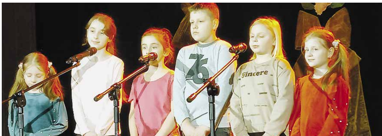
Nie mogło zabraknąć występów dzieci z sekcji w GCK Lelkovo