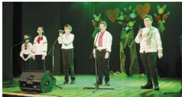
Na scenie popłynęły także piosenki w języku ukraińskim