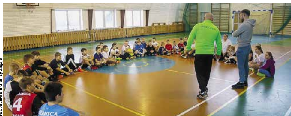
Zajęcia odbywają się na sali gimnastycznej w Szkole Podstawowej w Lelkowie

Działania te nie byłyby możliwe bez dofinansowania, jakiego gmina udzieliła Ludowemu