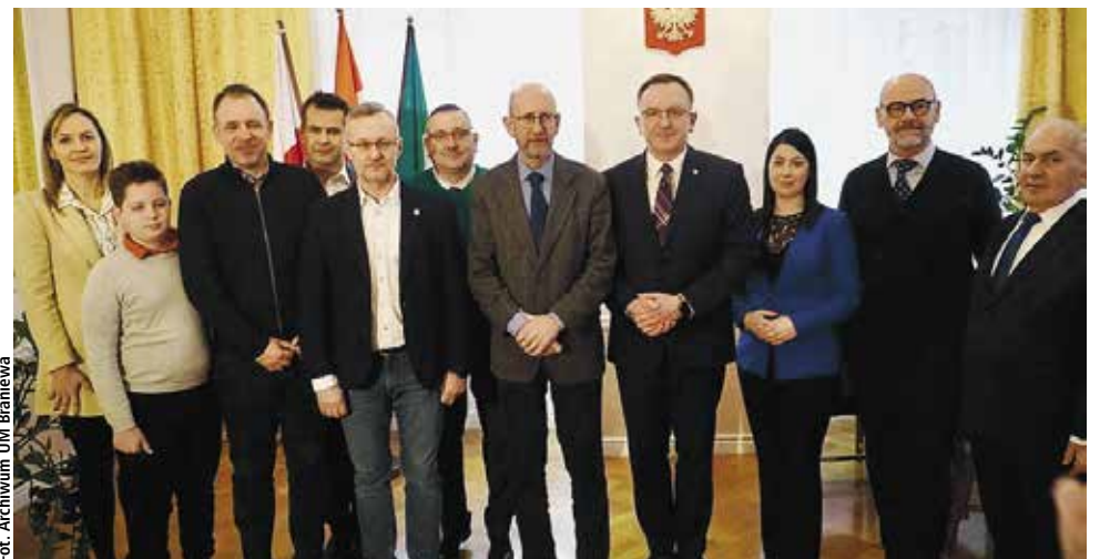
Uczestnicy podpisania umowy partnerskiej pomiędzy Braniewem a gminą Konavle

Konavle to region południowo-wschodniej Chorwacji, leżący w żupanii Dubrownik-Nadbuha. Jest to obszar geograficzny o