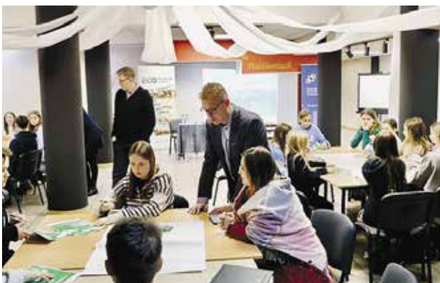
W szkoleniu uczestniczyli uczniowie z braniewskich szkół

Miasto Braniewo uczestniczy w roli partnera w projekcie „GreenUp 2022-2024 – młodzi na rzecz zielonej zmiany szkół i społeczności lokalnych”, którego liderem jest WAMA COOP Stowarzyszenie. Pozostałymi partnerami projektu są: Stowarzyszenie Gmin RP Euroregion Bałtyk, Elbląski Park Technologiczny oraz Fönix AS z Norwegii.